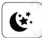
Lumină de urgență