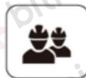
Construcții de noapte