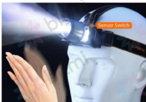
Senzor cu acționare prin gesturi