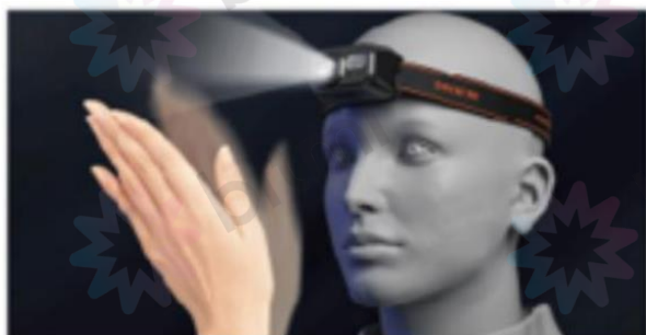
Demonstrație acționare prin gesturi

Apăsați butonul de inducție din stânga pentru a porni funcția de inducție; indicatorul de inducție se va aprinde. Puteți mișca mâna pentru a porni lumina într-un interval de 10 cm. Apăsați butonul din dreapta pentru a ajusta modul în mod normal și continuați să apăsați butonul de inducție pentru a opri funcția.