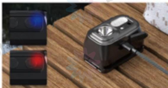
Demonstrație de încărcare