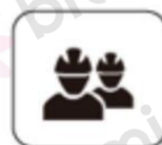
Construcții de noapte